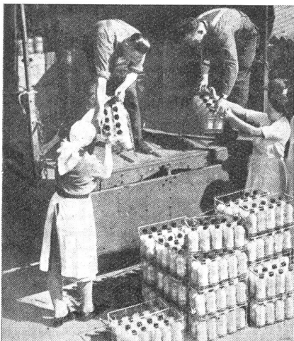
Verlad konservierten Blutes für die englische 8. Armee.

daß die Erfolge operativer Behandlung um so besser waren, je früher die Wundversorgung stattfand. Er schuf als Folge seiner Erkenntnis die «fliegenden Ambulanzen», um schon auf dem Schlachtfeld innerhalb von vierundzwanzig Stunden die Verwundeten behandeln und dann abtransportieren zu können. Larrey war selbst ein glänzender Chirurg und hat bei Borodino innerhalb eines Tages zweihundert Amputationen selbst vorgenommen.