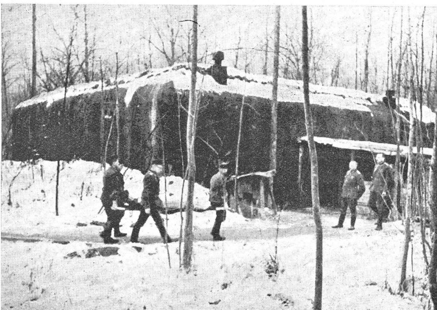
Antransport eines Verwundeten in einen Sanitätsbunker des deutschen Westwall.

Gestützt auf diese und andere Beob- achtungen setzte in den darauf folgen- den Jahren ein großer Gelehrtenstreit ein, der aber unentschieden ausging: keine der Ansichten, die zur Debatte standen, mußte die Segel streichen, denn es wurden Verbesserungen auf einer andern Ebene erzielt: der erste Wundarzt Napoleons in zwei Feldzügen, Larrey , entdeckte den Faktor Zeit in der Wundversorgung. Er stellte fest,