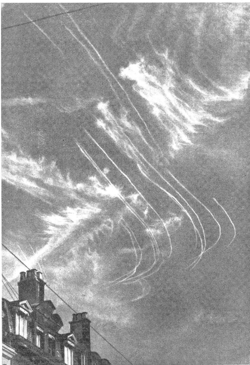
Selbst zwischen echten Wolkenformationen sind die Kondensstreifen deutlich erkennbar.