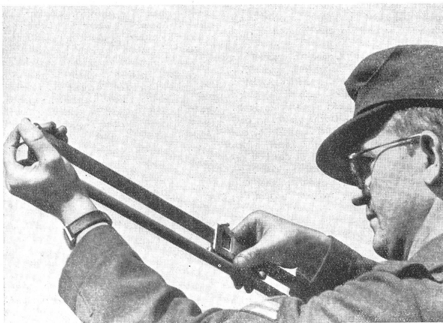
Mit einer Spezial-Schublehre wird der Abstand zwischen den beiden Kerben auf dem größtem Fallgewicht gemessen: eine einfache Formel ergibt dann die Anfangsgeschwindigkeit des Geschosses.

schoß das Rohr verläßt. Ist diese bekannt, so können die Granaten richtig «tempiert» werden. Der V-Null-Trupp führt zu seinen Untersuchungen auf einem Auto mit Anhänger wissenschaftliche Meßinstrumente mit sich, denn die Anfangsgeschwindigkeit ist bei modernen Geschützen enorm hoch. Die Messungen erfolgen mit dem von einem Franzosen erfundenen Boulanger-Apparat auf magnetelektrischem Wege. Die Granate wird magnetisiert und passiert anfangs ihrer Flugbahn zwei Spulen; der Moment des Vorbeifluges erzeugt einen Stromstoß. Die erste Spule löst ein größeres Fallgewicht aus, die zweite ein kleineres, das in das erste Gewicht durch ein Schlagmesser eine Kerbe schlägt. Die Messung mit einer Lehre ergibt den neuen V-Null-Wert, der für die weiteren ballistischen Berechnungen ausschlaggebend ist.