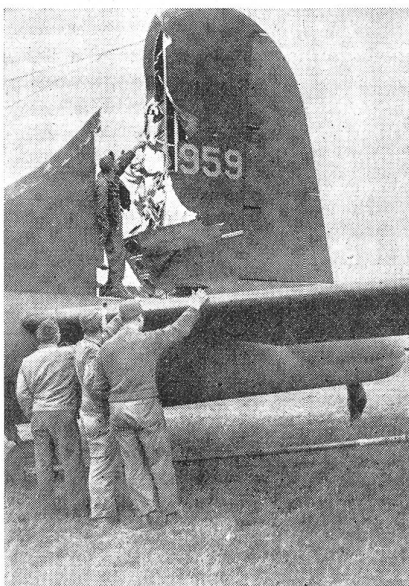
Schwer beschädigt und doch glatt gelandet. Bei einem Angriff auf Westeuropa wurde diese «Fliegende Festung» beschädigt, konnte aber trotz schweren Defekten englischen Boden erreichen, wo sie glatt landete.

Aus dem Gesagten geht hervor, daß es sowohl der Flieger wie auch der Flabkanonier oder Flab-Mg.-Schütze schießtechnisch nicht leicht haben, zum Erfolg und damit zur Erfüllung ihrer kriegsmäßigen Aufgabe zu gelangen. Beim Flieger kommt als Voraussetzung des Erfolges nebst den schon erwähn-ten kämpferischen Eigenschaften hinzu, eine in scharfer methodischer Drillarbeit erworbene maschinelle Beherrschung aller technischen Funktionen, dazu eine starke Dosis taktisches Gefühl; beim Erdkämpfer und Flabkanonier oder -schützen eine virtuos zu nennende Erfassung und Ausnützung der sich bietenden Abschusßmöglichkeiten. Man trachtet, seinen Feind durch die Lenkung des Feuers womöglich in die Position hineinzuzwingen, welche dem