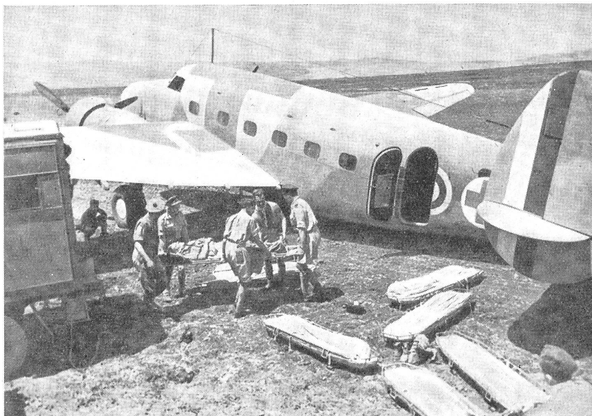
Rasche Hilfe — Wirksame Hilfe. Starbereites englisches Sanitätsflugzeug auf einem süditalienischen Flugplatz.

Ueber die Behandlung der Schußwunden haben sich nun im Laufe der Zeit die Ansichten stark gewandelt. Die ältere Chirurgie glaubte noch, die Schußwunden seien giftig, und meinten demnach, sie müßten mit siedendem Oel oder glühenden Eisen ausgebrannt werden. A. Paré war der erste, der — durch einen Zufall — mit dieser Behandlung brach. Das Oel war ihm aus-