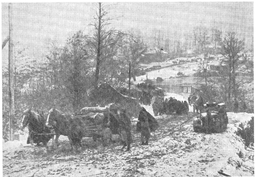
Rückmarsch auf einer russischen Landstraße im Spätherbst.

Indien steht nach wie vor im Brennpunkt der politischen, wirtschaftlichen und militärischen Ereignisse in Asien. Das Buch gibt uns in leichtfaßlicher Weise Aufschluß über dieses, für uns Europäer nach wie vor rätselhafte Land. Wir können dieses Werk sehr empfehlen.