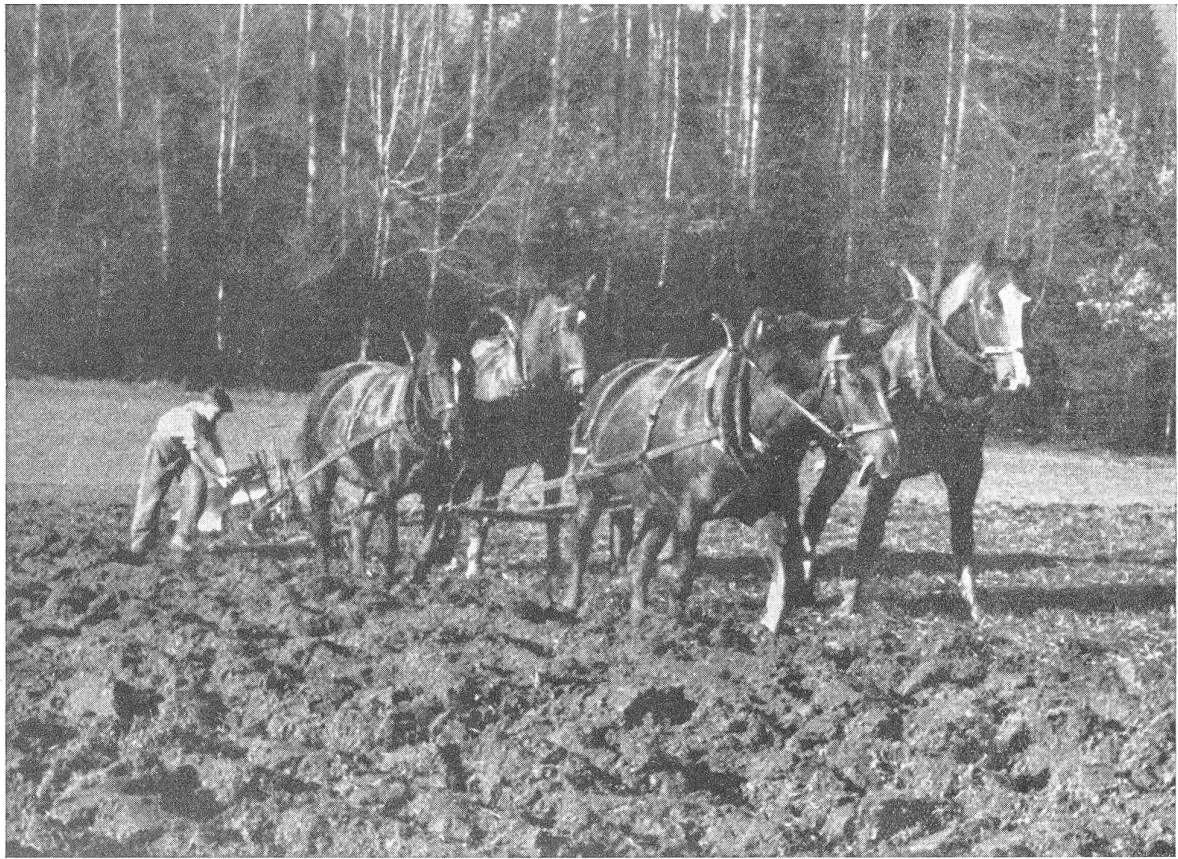
Pferdezucht und Anbauschlacht — Halbblut-Zuchtstufen an der Arbeit.