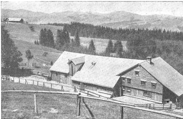
Halbblut-Bergfohlenhof Teufenberg bei Urnäsch.