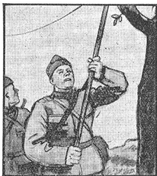
„I alle Regimänte, bi jeder Kompanie, müend dere Sapermente zum telefönle si.“