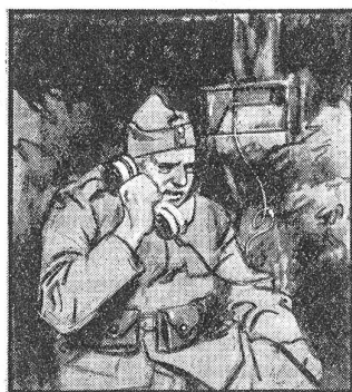
„Dü Poschte isch gar wichtig, wenn's de is Träffe goht. Dass me's Kommando richtig zäh Schtunde wit versteht.“