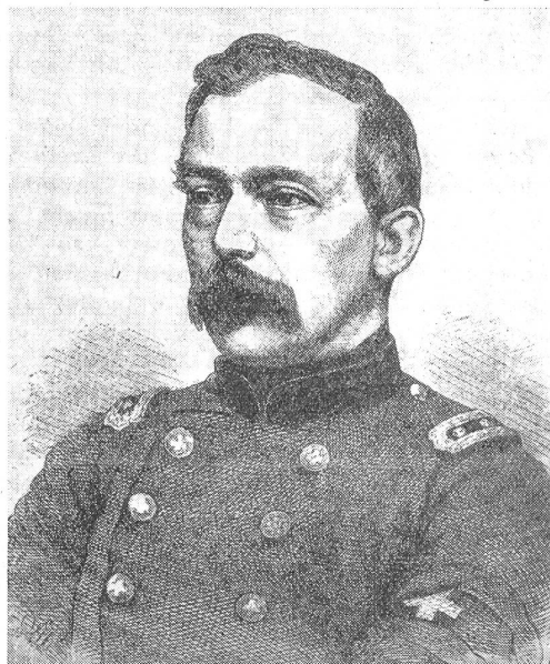
Bildnis des Generals Hans Herzog.

Artillerie eingeweiht wurde und als Kantonsschüler zum Kadettenhauptmann avancierte. Nach der Konfirmation verbrachte der junge Herzog zwei Jahre in Genf, wo er neben gründlicher Erlernung der französischen Sprache auch Gelegenheit zu mathematischer, chemischer und physikalischer Weiterbildung hatte und unter anderem auch den damaligen Obersten und spätern General Dufour zu seinen Lehrern zählen durfte. Nach seiner Rückkehr mußte er sich, dem Willen seines gestrengen Vaters fügend, dem kaufmännischen Berufe widmen, betrieb aber die ihm lieb gewordenen chemischen und physikalischen Studien weiter und wurde mit erst 19 Jahren in die Naturforschende Gesellschaft aufgenommen. Ein Jahr später besuchte er als Aspirant für den