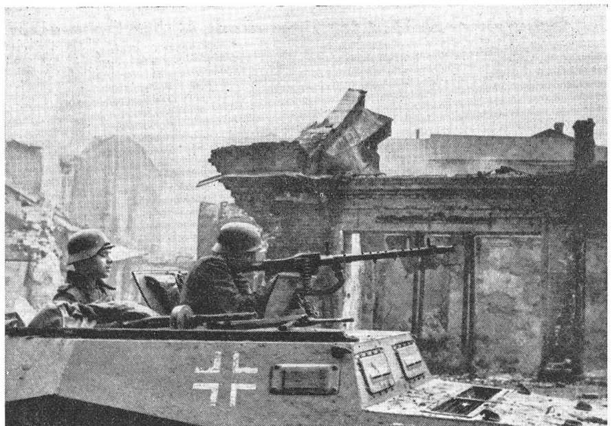
Stalingrad: Deutsches Sturmgeschütz im Kampfeinsatz in einer Straße.

Die Tage, die Stalingrad damals durchlebte, waren die kritischsten der ganzen Schlacht. Mit dem Rücken zur Wolga mußten die ermüdeten Vertei-