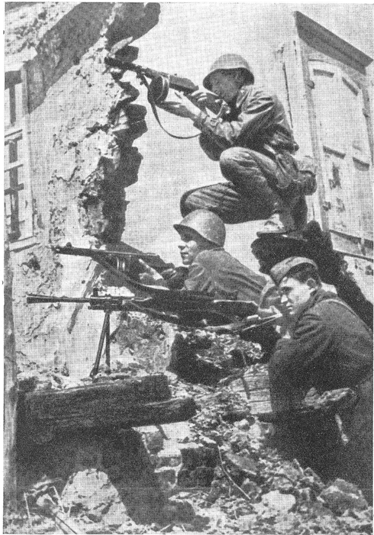
Stalingrad: Auf der Ruine eines Wohnhauses verschießen zwei russische Infanteristen und ein Soldat eines Arbeiterbataillons ihre letzten Patronen ...

Trotz all diesen Gefahren beschloß General Rodimzew, anzugreifen. Er setzte sein drittes Regiment über den Fluß. Es trat sofort in Aktion und schloß sich dem meistbelasteten Regiment an, das damals die Deutschen aus einer Anzahl großer, schwer befestigter Ge-