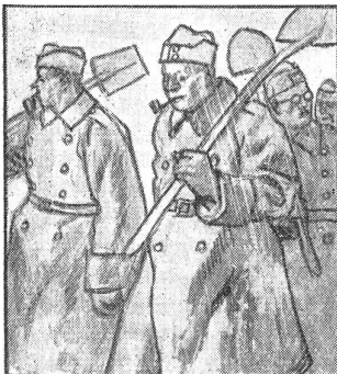
Müde von der ungewohnt harten Arbeit kehren unsere Soldaten ins Kantonement zurück.

Eine andere Gruppe hatte inzwischen die Brücke über den Fluß Slutsch, die über 270 m lang war, in die Luft gesprengt. Auch hier hatten sich die Partisanen durch den Stacheldraht geschlängelt und die Deutschen bemerkten den Ueberfall erst, als die Brücke in die Luft flog. Nach der Explosion zogen sich die Partisanen in kleinen Gruppen zurück. Unterwegs zerstörten sie noch die Verbindung zwischen den Bahnhöfen Dombrowitz und Biala, steckten die Automobilwerkstätte in Brand, zerstörten zwei