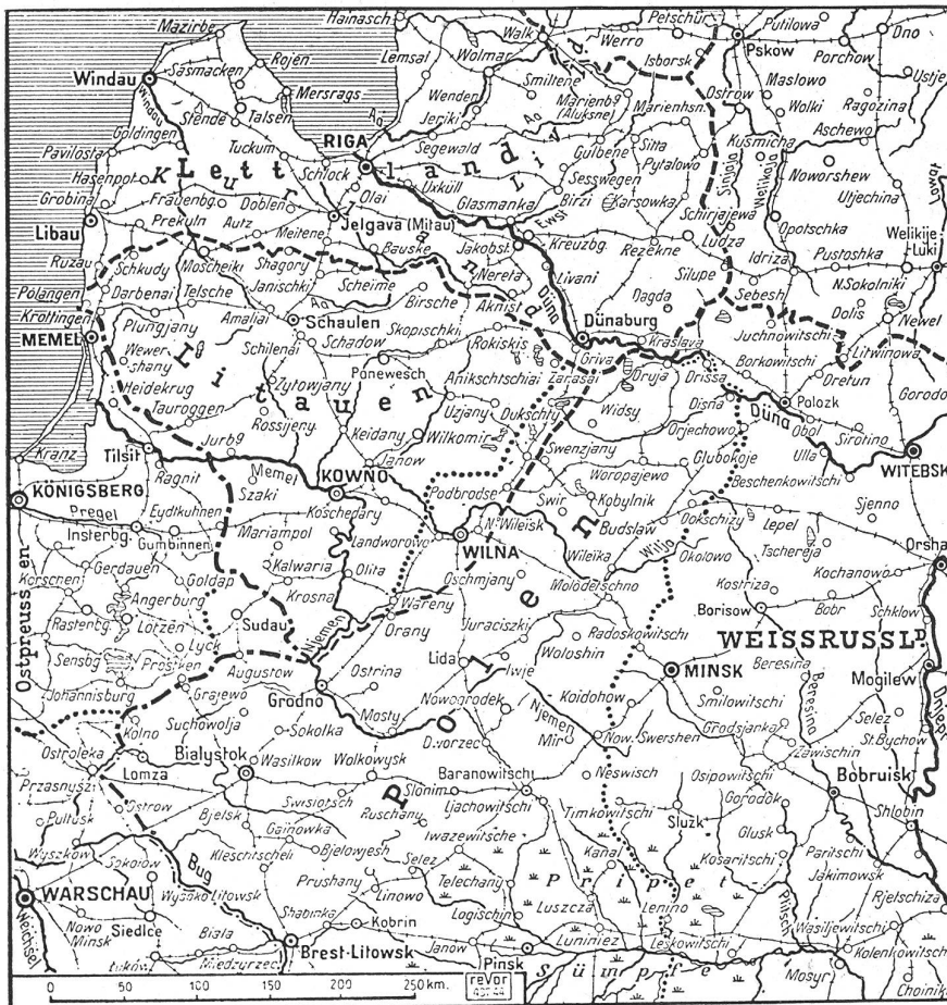
Der Kriegsschauplatz in Polen

Der britischen Armee war jedoch nach diesem Vorstoß keine Atempause gegönnt. Griechenland, das sich bis anhin siegreich und tapfer gegen die Italiener behauptet hatte, befand sich, nun auch von Deutschland angegriffen, in einer äußerst prekären Lage. Trup-