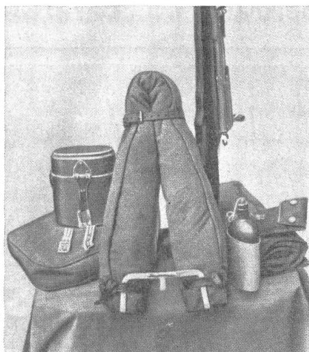
(VI 10595 SN)