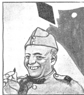
Gaba nehmen — Gaba nützt, Gaba schicken — Gaba schützt.