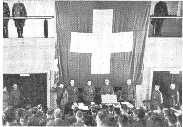
(VI Bu 18695)

Herr Oberstdivisionär Jordi überbrachte hierauf die Grüße und den Dank des Chefs des EMD. für die vom SUOV. geleistete Arbeit. Er sprach dann in markanten Worten von den Hauptaufgaben, die dem Unteroffizier zufallen: Ausbildung und Erziehung. Die Vorgesetzten aller Grade bewußt sein stets der Bedeutung des eigenen Beispiels. Nur wenn wir unsere Hauptverpflichtung darin sehen, durch