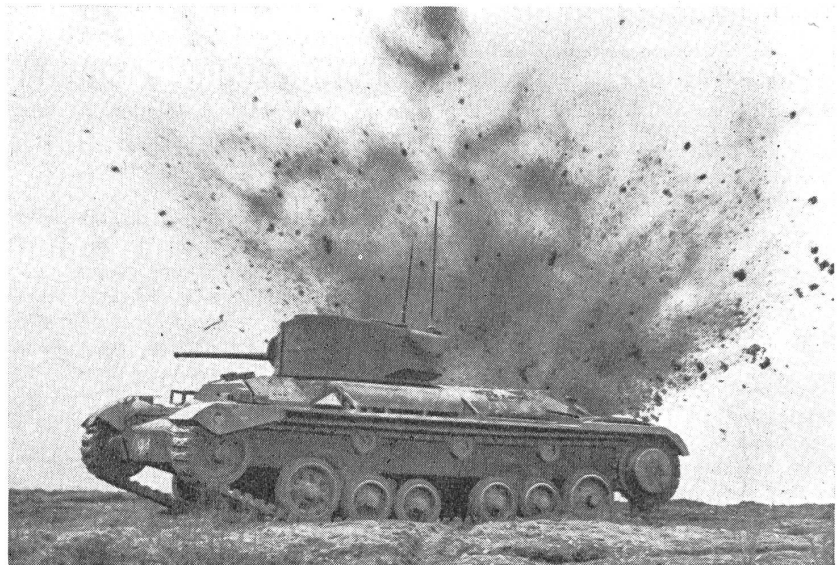
«Valentine»-Panzerkampfwagen in Aktion.

ausgerüstet. Dieser entwickelte eine Leistung von 138 PS. Die Ersetzung des Benzinmotors durch einen Dieselmotor bewirkte eine höhere Geschwindigkeit. Die Panzerung wurde ebenfalls verstärkt. Ein weiterer Vorteil der Verwendung des Dieselmotors stellt die verminderte mitzuführende Treibstoffmenge dar; diese beträgt nun nur noch 145 Liter. Eine große Anzahl von «Valentine»-Panzerkampfwagen mit GMC-Dieselmotoren wurde in Kanada herge-