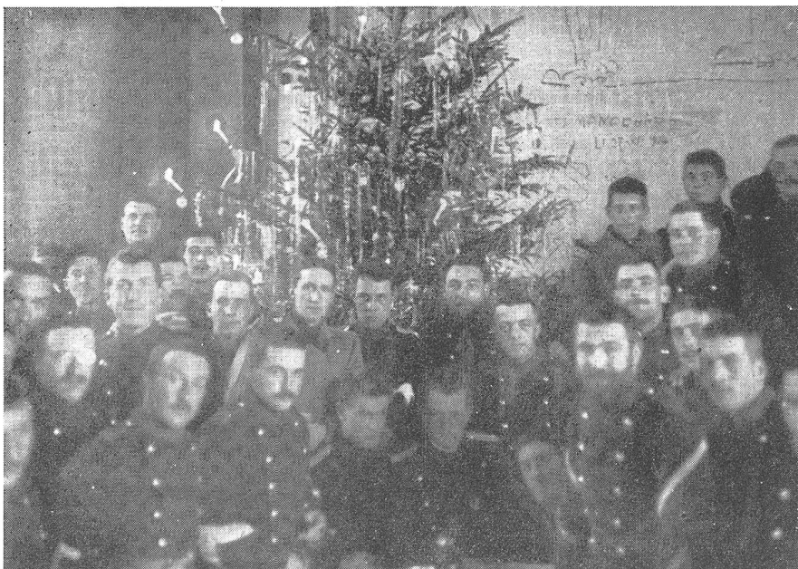
Grenzbesetzung 1914—18, Weihnachtsfeier des Bat. 10 in Kirchberg.