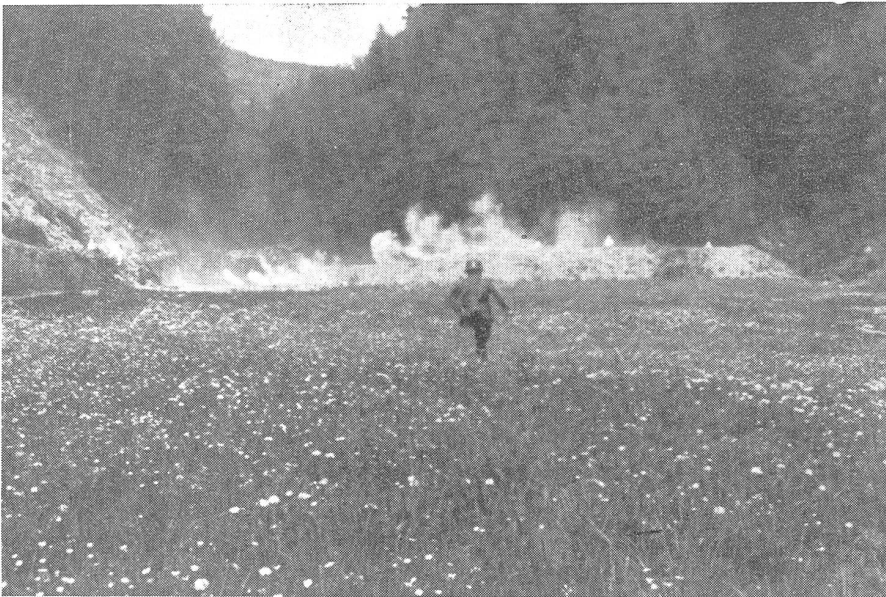
Ueberschießen eigener Truppen. 1. Phase: Die Garben der überschießenden Mg. liegen hart auf der Kante der Geländeböschung.