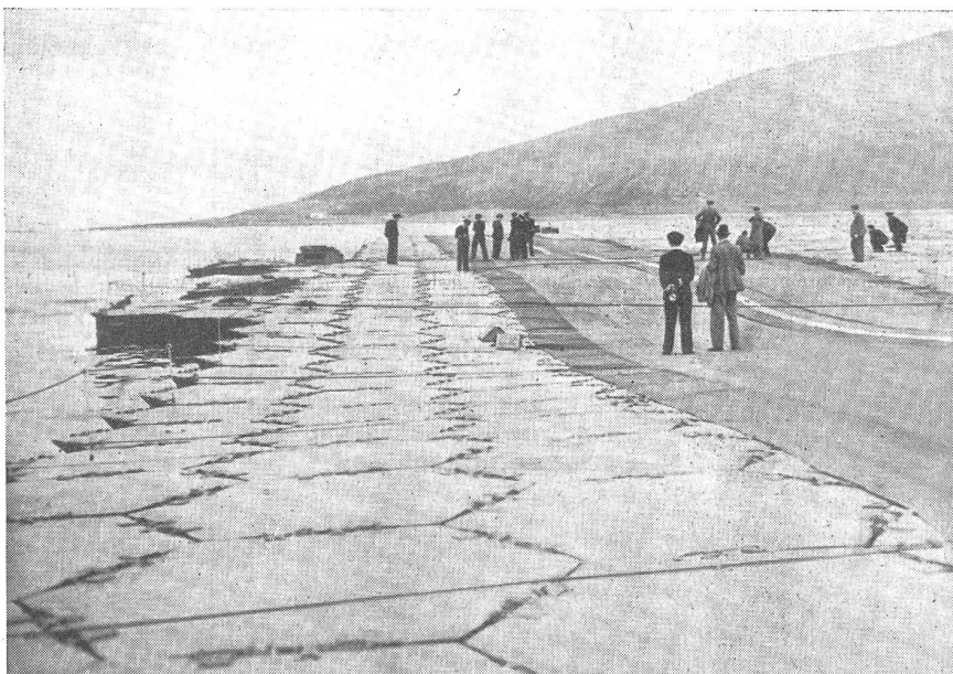
So sieht das «Lily»-Flugfeld aus. Hier sieht man deutlich, wie die flexible Natur der Konstruktion dem Wellengang nachgibt.