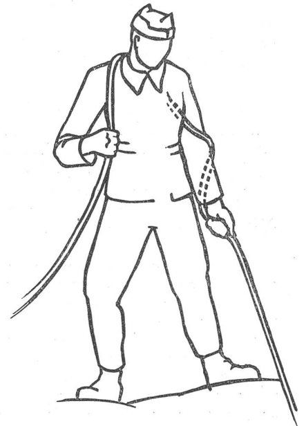
Handhabung des Sicherungsseiles

10. Sicherheitsvorkehrungen haben nichts mit feiger Aengstlichkeit zu tun. Ein durch sie verhüteter Unfall ist die tausendfache unnötige Anordnung von Sicherheitsmaßnahmen wert. Ein routinierter und verantwortungsbewußter Seiltechniker sieht vor einer Aktion die bestehenden Unfallgefahren voraus und baut dementsprechende Sicherungen ein.