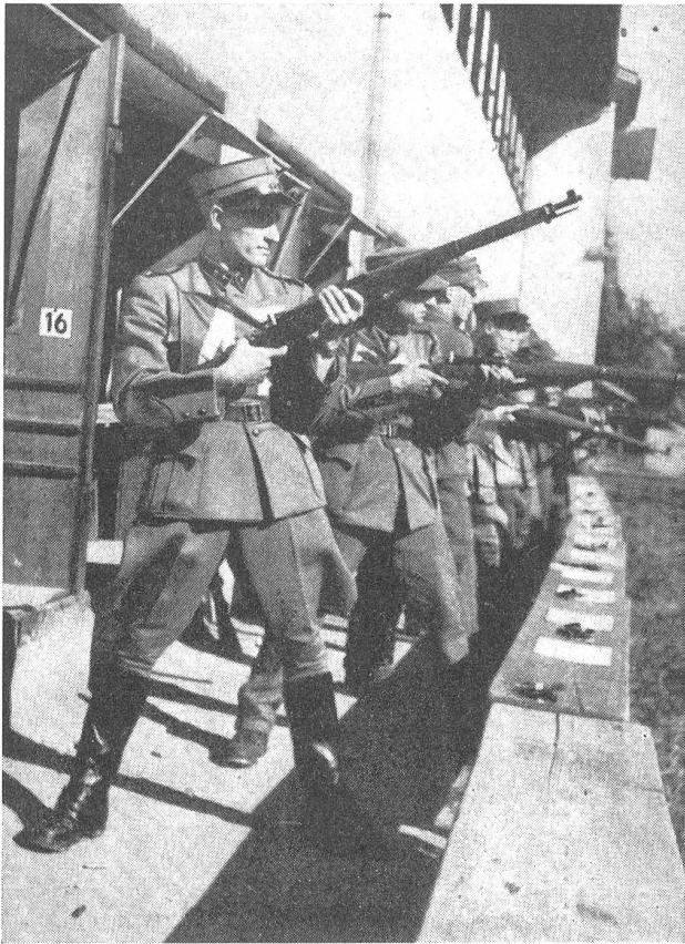
Vierkampf beim Schießen.