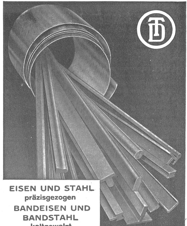
EISEN UND STAHL präzisgezogen BANDEISEN UND BANDSTAHL kaltgewalzt