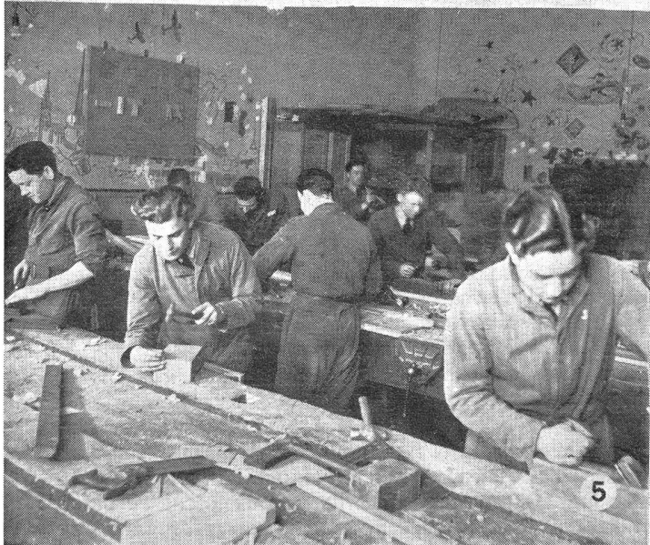
① Praktischer Unterricht auf einem belgischen Militärflugplatz.