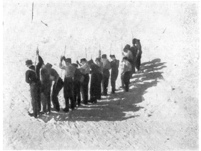
Lawinendienst. Die Offiziersklasse beim Sondieren.

Bereits wird in der Berner Division das Ziel wieder weitergesteckt. Vom 18. bis 28. August findet auf der Furka der nächste freiwillige Sommergebirgskurs statt, für den bereits eine stattliche Zahl von Klassenlehrern und Kursteilnehmern gemeldet sind. Auf Wiedersehen im Sommer auf der Furka!