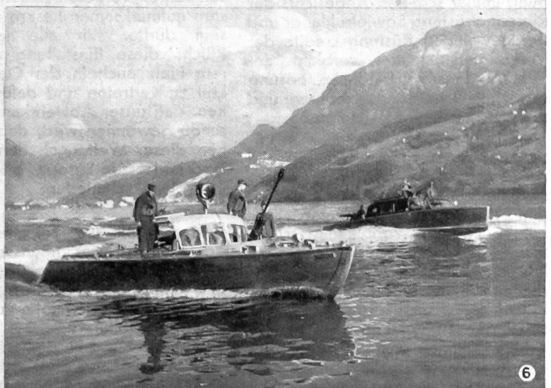
① Unsere zu «Bootschützen» ausgebildeten Motorbootsoldaten dürften die einzigen Schweizer Wehrmänner sein, die in Wasserstiefeln zur Arbeit antreten. ② Befehlsausgabe an Bord des «Flaggschiffs». ③ Die Waffen werden an Bord gebracht und gefechtsbereit montiert. ④ Der Kommandant der «Sargans» hat den Auftrag erhalten, das Boot zu landen und mit einem Tarnschutz zu versehen. ⑤ Das ist das Resultat! Kein Mensch würde vermuten, daß hier ein aktionsbereites Boot am Ufer verläuft liegt. ⑥ Die beiden Boote «Bönigen» und «Luzern» bei der Fahrschule in voller Fahrt auf dem Vierwaldstättersee.