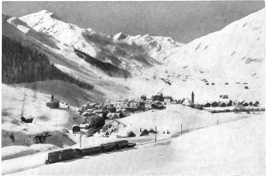
Andermatt gegen Furka