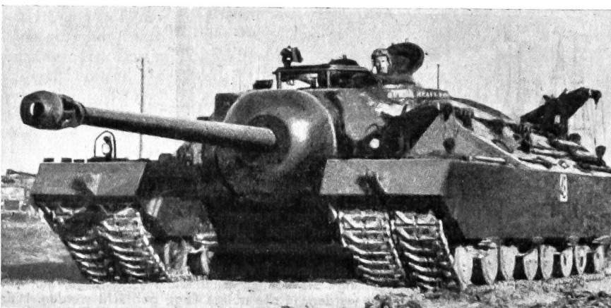
Amerikanisches Sturmgeschütz «Gigant», ca. 100 Tonnen, 122-mm-Kanone