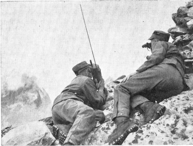
Hoch über dem Rhonegletscher späht ein Beobachtungsposten über die Alpenwelt der Furka.

jenes schwer zu beschreibende «Aufeinander-Eingestelltsein», das Stärke und Schwäche des Seilkameraden instinktiv erfühlen läßt und alle Worte überflüssig macht.