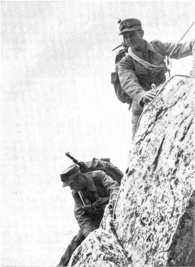
Sie haben gelernt, den Tiefblick zu ertragen.

Alpintechnik. Es darf dem Gebirgssoldaten nicht gleichgültig sein, mit wem er sich am gleichen Seil auf Leben und Tod verbindet. Die Kameradschaft einer Seilschaft ist vielleicht das Höchste; sie kann auch die schwerste Bewährung fordern.