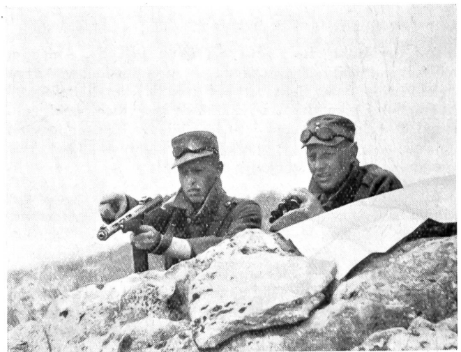
Eine feindliche Patrouille wird entdeckt und zur Bekämpfung näher herangelassen.

Der nächste Schritt bringt das Gehen am Seil in der Dreierpartie. Sicher und wendig wird die schwerste Stelle überwunden, wenn sich Kamerad von Kamerad gesichert weiß. Die Zusammenarbeit der Seilschaft verlangt nicht nur technische Beherrschung und Vollendung, sondern auch