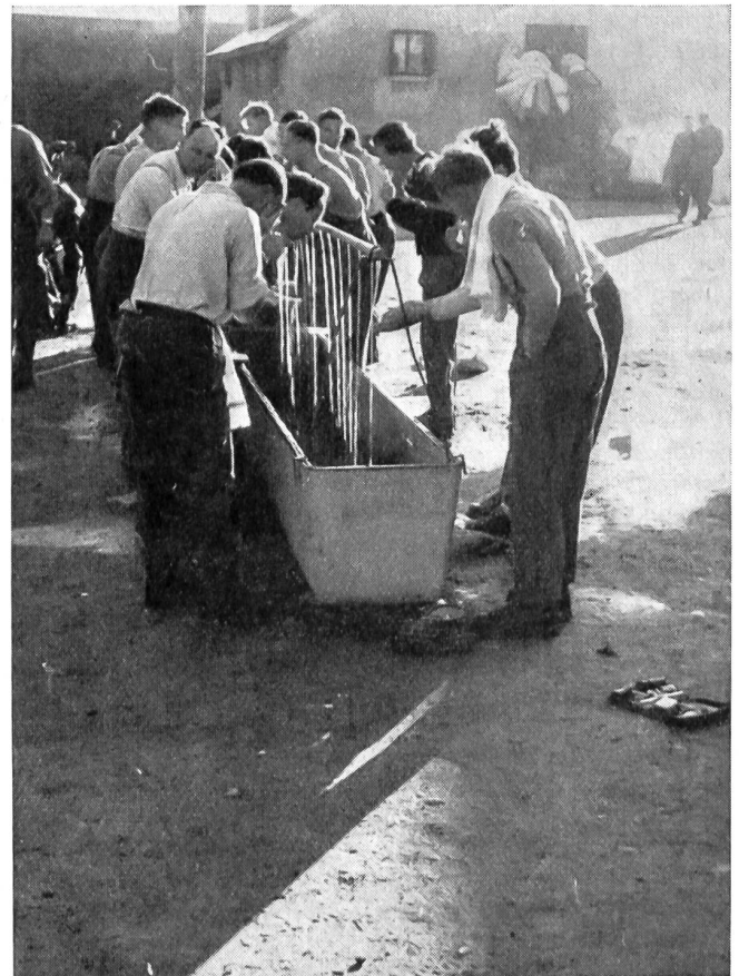
Fünf Minuten nach der Tagwache im Barackenlager auf der Furka.

Wert und die Notwendigkeit der freiwilligen Gebirgskurse bewußt und es ist den vereinigten Bemühungen schlufendlich gelungen, die die außerdienstliche Gebirgsausbildung hemmenden Schwierigkeiten aus dem Wege zu räu-