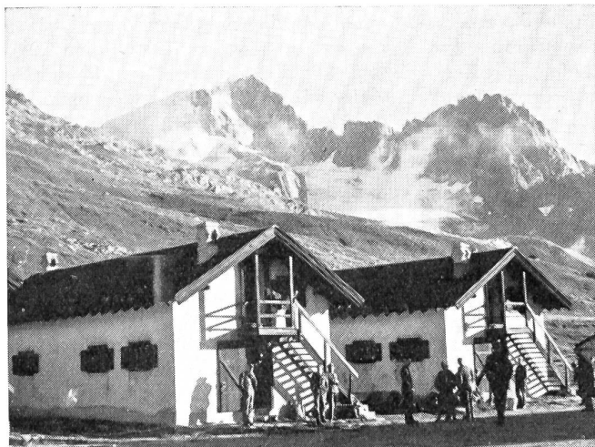
Die Militärbaracken auf der Furka sind den außerdienstlichen Gebirgskursen der Heeresseinheiten eine zweckmäßige und ideal gelegene Unterkunft.

men. Es sei zum Beispiel nur erwähnt, daß diese Kurse heute der Militärversicherung unterstellt sind und die 15 bis 20 Franken eingespart werden können, die früher pro Kursteilnehmer an eine Versicherungsgesellschaft bezahlt werden mußten. Die Militärversicherung gilt heute allerdings nur für Unfälle. Es ist aber zu hoffen und zu wünschen, daß in absehbarer Zeit auch in solchen Kursen zustoßende Krankheiten mitversichert sind.