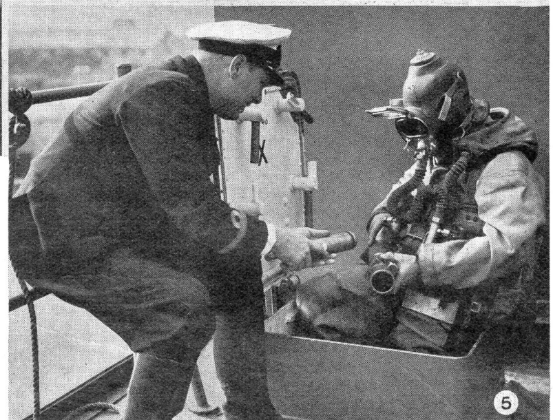
Im Schulschiff auf dem Lande Ausbildung der „Verteidigungs-Einheiten“ der britischen Kriegsmarine