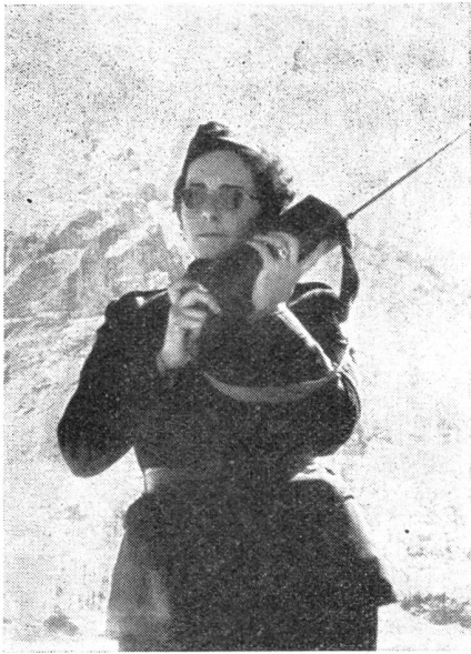
Auch die FHD gehören zum Bestand der Lawinen-Kompagnie. Sie und das Foxgerät leisten wichtige Dienste in der Aufrechterhaltung der notwendigen Verbindungen.

fährlichen Hänge, bildeten die ersten Phasen der von Hptm. Schild geleiteten Übung.