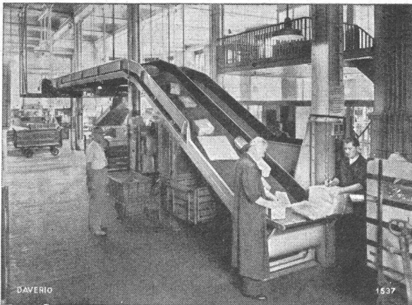
Teilansicht einer Paketförderanlage

Transport-Anlagen Getreide-Mühlen Getreide-, Malz- und Kohlen-Silos Brech- und Sortieranlagen für Kohle und Koks Kesselbeschickungsanlagen Ölwalzwerke, Schlagmühlen