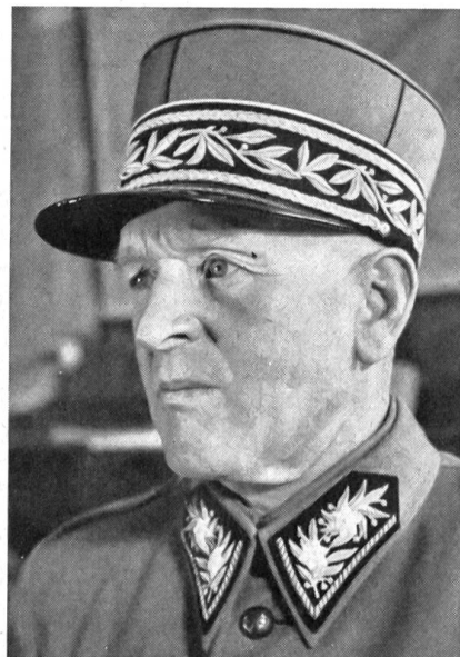
Oberstkorpskommandant Jakob Huber †

Im Bezirksspital Interlaken ist im Alter von 70 Jahren Oberstkorpskommandant Jakob Huber, Generalstabschef der schweizerischen Armee im Zweiten Weltkrieg, gestorben. Der Verstorbene, seit 1908 Instruktionsoffizier der Artillerie, wurde 1937 zum Oberstdivisionär befördert. 1940 übernahm er den Posten des Generalstabschefs, den er bis 1945 innehatte. 1941 wurde er zum Oberstkorpskommandanten ernannt. Er war maßgebend an der Schaffung des Réduit beteiligt.