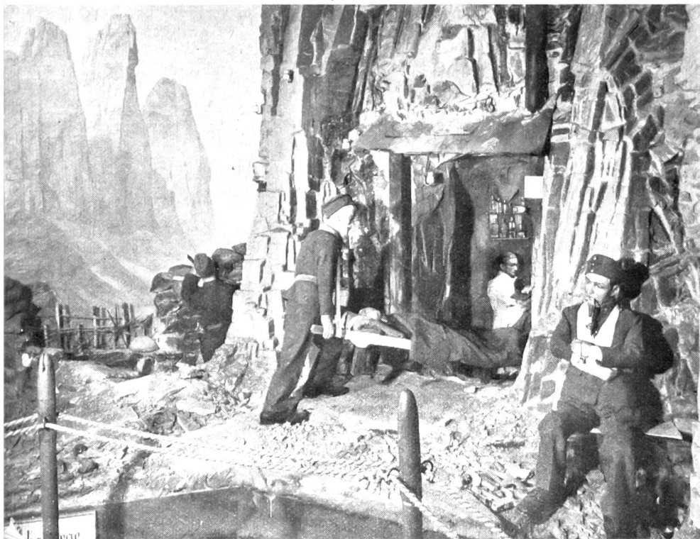
Ein lebensgroßes Diorama, eine Verwundetensstation in den Dolomiten darstellend.

Die Beantwortung dieser Fragen mag vielleicht gerade heute von ge-