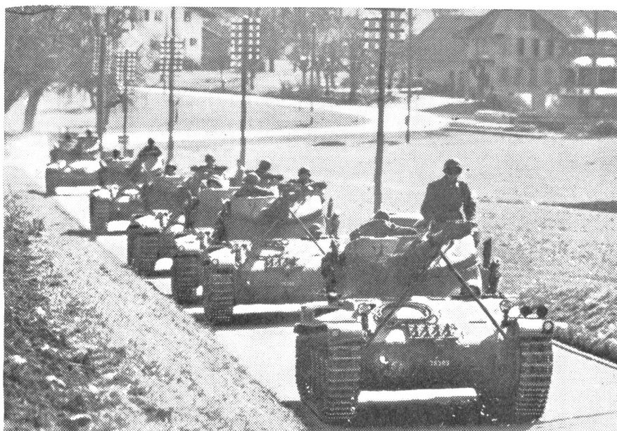
Ein Bild, das da und dort nicht mehr fremd anmuten wird: Straßenfahrt mit L. Pz. 51.

fügung stehende Zeit. Die Wehrmänner, welche sich freiwillig für die Umschulung gemeldet hatten, leisten dieses Jahr zu ihrem Wiederholungskurs freiwillig noch weitere drei Wochen Dienst. Von diesen sechs Wochen stehen für die Ausbildung selbst aber nur rund fünf zur Verfügung, denn abzuziehen sind Einrückungs- und Entlassungstag und die Zeit für die Umbe- waffnung und sonstige Zeughausarbeiten. Die Fahrzeugfassung, der Großparkdienst und die Fahrzeugabgabe beanspruchen ebenfalls drei bis vier Tage. Die kurze Ausbildungszeit zwingt zu einer restlosen Spezialisierung, auch wenn man kein Freund dieses Systems ist. Während des Umschulungskurses wird ein Mann entweder als Panzerfahrer oder Panzerriecher oder Panzer-