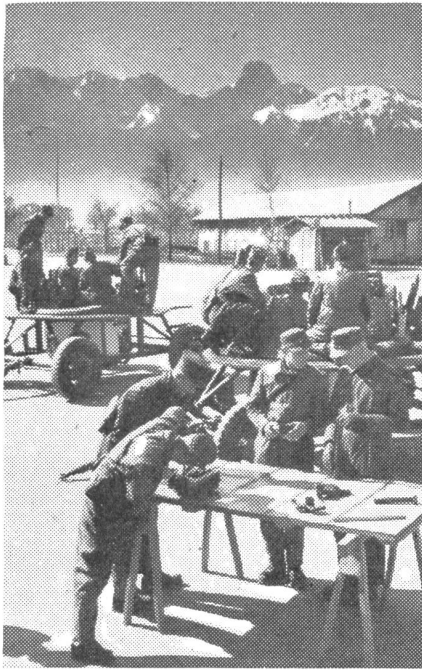
Ausbildung der Richter am Turmmodell und Geschütz.

gefechtsordnanz oder als Panzergrenadier ausgebildet.