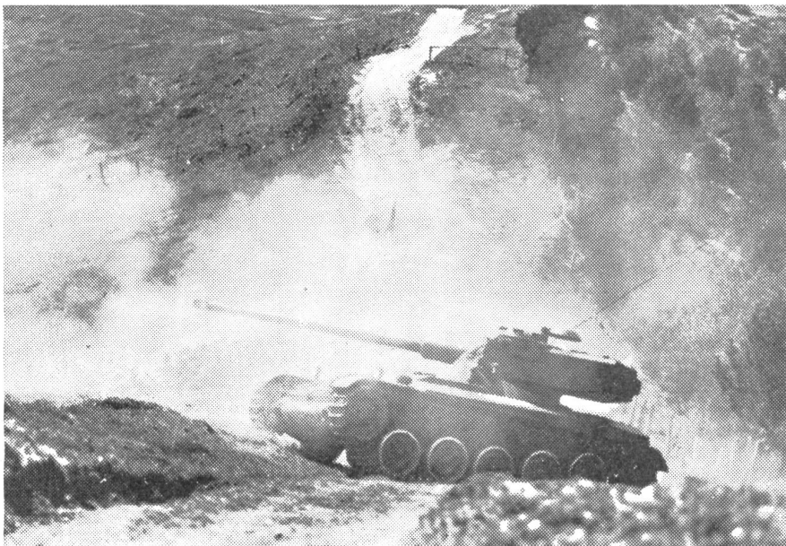
L. Pz. 51, wie der französische AMX-13-Leichtpanzer bei uns offiziell heißt, in Feuerstellung anlässlich eines Gefechtsschießens im Gurnigelgebiet. Das Geschütz kann dank dem um 360 Grad drehbaren Turm rasch in jede Richtung schießen.

längerer Zeit verfolgen zu können. Praktisch muß man damit rechnen, daß rund ein Jahr vor der Einführung neuer Panzer mit der Ausbildung der Instruktoren begonnen werden muß.