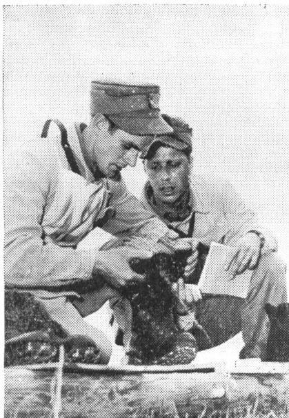
2. Schweiz. Feldweibelstage in Zürich.

Je vollkommener die hochentwickelte technische Wissenschaft unserer Tage die Feuerwaffen gemacht und andere raffinierte Mittel gebracht hat, desto mehr erfordert die Kunst, sie richtig zu brauchen und vollen Nutzen von ihnen zu haben, das Manneswesen, das gleichmütig sagt, wenn es hätte sein müssen, wäre es auch ohne die gegangen. General Wille (1848—1925)