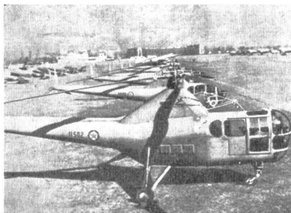
Die neuesten Lieferungen an die jugoslawische Luftwaffe durch Amerika umfassen auch Helikopter, die unser Bild bei ihrer Ankunft auf dem Flugplatz von Belgrad zeigt.

Der Besuch von Museen, die wie dasjenige von Thun oder die sehenswerten Sammlungen in Paris oder Brüssel, der Armee und der Militärgeschichte reserviert sind, vermittelt jeweils einen interessanten