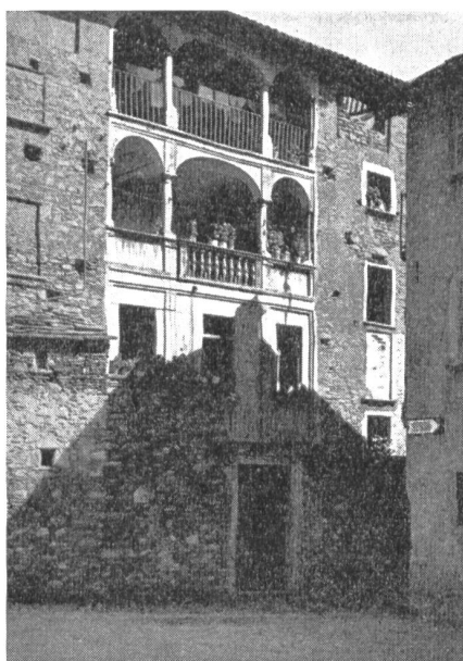
Astano. Ansicht des «Cá da Roma».

Anmeldeformulare können vom Sekretariat der AMVZ, Genferstraße 2, Zürich 2, bezogen werden und sind bis zum 24. August 1954 einzureichen.