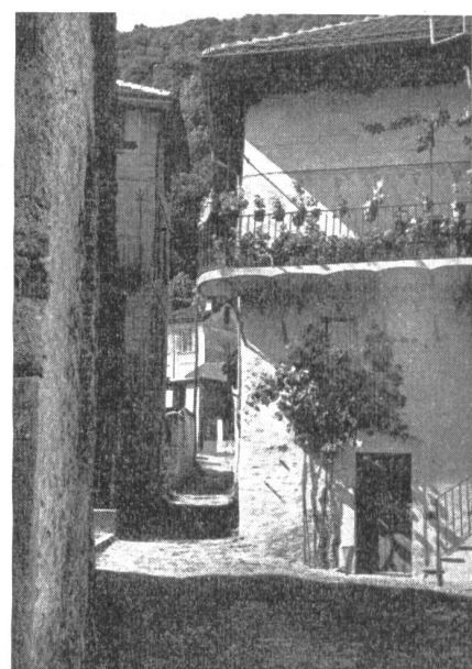
Astano. Ein altes, verträumtes Gäblein.

Astano ist ein verträumtes Dörfchen und liegt — Gott sei Dank! — abseits der großen Heerstraße. Ein einziges, aber gut geführtes Gasthaus sorgt für das leibliche Wohl fremder Gäste, die trotz aller Abgelegenheit immer wieder den Weg nach diesem Paradies finden. Man möchte für immer dort bleiben, eins werden mit der wundersamen Landschaft und aufgenommen werden in die Gemeinschaft des Ortes. Schön ist unsere Heimat, und es lohnt sich wohl, daß wir für sie einstehen — heute und morgen und immerdar.