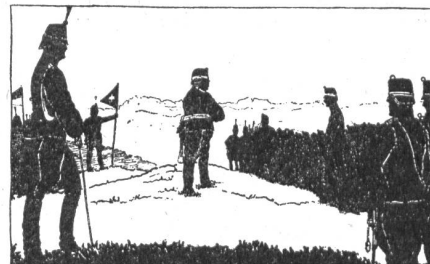
Kritik (von Wilfried Schweizer)

geschichtlichen Abteilung leitet, schildert in dem reich bebilderten Werk die Gestaltung der Kulturlandschaft in der älteren, mittleren und jüngeren Steinzeit, der Bronzezeit und der älteren und jüngeren Eisenzeit (Hallstatt und La Tène) sowie die Weiterentwicklung des Wirtschafts- und Siedlungswesens in der Römerzeit und in der alamannischen Epoche nach der Völkerwanderung. Die vielseitig ausgebauten Darstellungen sind immer auf die Landschaft bezogen, so daß unsere heimatliche Umwelt den lebensvollen Hintergrund der Schilderung der einzelnen Epochen bildet.