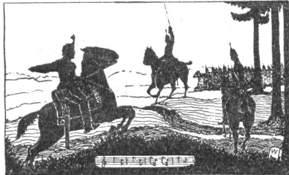
Kavallerie (von Wilfried Schweizer)

Wollen wir unsere Mitbürger vor dem Eintritt in die Fremdenlegion bewahren, so müssen wir viel früher einsetzen und vor allem dafür sorgen, daß sie nicht auf die schiefe Bahn geraten. F.