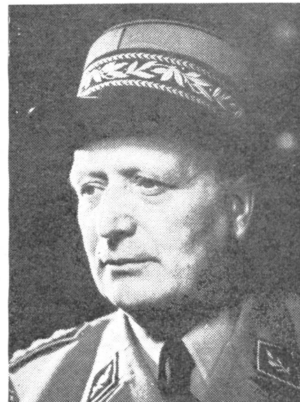
Oberstkorpskommandant Marius Corbat der neue Ausbildungschef der Armee. Bisher Kdt. I. Armeekorps.

Erstes Gebot für die Leute der Nachschubkolonnen ist: Absolute Disziplin; vollkommenes Rauch- und Sprechverbot in der Bewegung; Verbot des Abweichens vom festen Grunde, bzw. der festen Straße; Wegwerfen von Gegenständen, insbesondere hellen, oder leuchtenden, Todsünde; Herum-