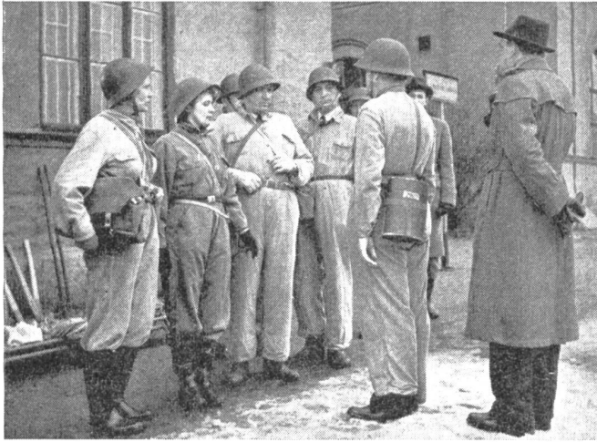
Das sind die Angehörigen einer Werkschutzgruppe, angetreten zu einer Uebung, die während der Arbeitszeit zur Weiterbildung angesetzt wurde.

Zivilverteidigungsamt oder den Länsgovernmenten unterstehen. In der Praxis wird der Hauptteil der Ausbildung durch Instruktoren getragen, die sich freiwillig für ihre Aufgabe gemeldet und vorbereitet haben. Der Bedarf an Instruktoren wird heute mit 4000 Personen angegeben; davon stehen bereits 2000 zur Verfügung. Die Ausbildung dieser Instruktoren dauert einen bis anderthalb Monate. Mehr als Worte zeigen die folgenden Bilder, die einen eindrucklichen Querschnitt des hohen Standes der schwedischen Zivilverteidigung vermitteln.