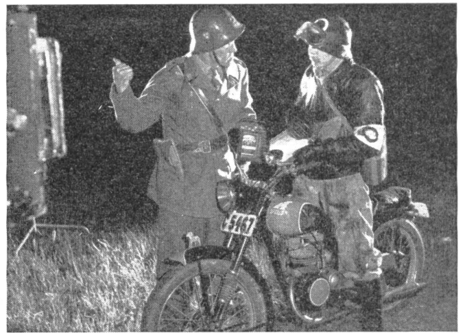
Eine wichtige Funktion erfüllt der Ueberwachungs- und Ordnungsdienst, dem auch der Kampf gegen Spione und Saboteure übertragen wurde. Das große O am linken Arm bezeichnet den Träger als Mann dieses besonderen Dienstzweiges der schwedischen Zivilverteidigung.