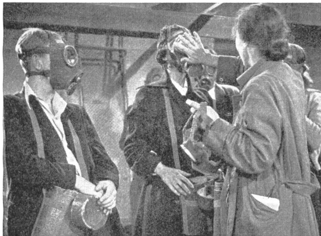
Der Gasschutzdienst befaßt sich mit der Abgabe und der Verpassung von Volksgasmasken an die Bevölkerung. Die Heimschutzleiter werden unter anderem auch im richtigen Verpassen der Gasmasken geschult.