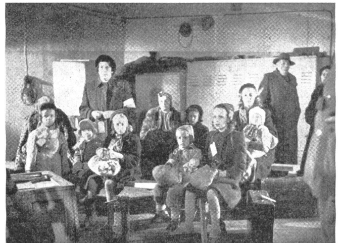
Eine sehr wichtige Rolle spielt der Evakuierungs- und Sozialdienst, der in besonderen, oft ganze Städte und Landschaftsteile erfassenden Uebungen geschult wird. Unser Bild zeigt die Betreuung von Kindern in «ausgebombten Stadtteilen», die, mit Personalkarten versehen, auf ihren Abtransport warten.