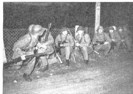
Aufklärung bei Nacht.

Fast zwei Drittel aller Mitarbeiter haben sich für den Ueberfall entschieden, der teilweise mit einer Sprengung der Bachbrücke oder der Sprengung einer Baumsperrre am Waldrand bei B — im Augenblick der Auslösung des Angriffes — verbunden wird. Wichtig ist bei der Wahl dieser Lösung, daß die Absprache des Vor-