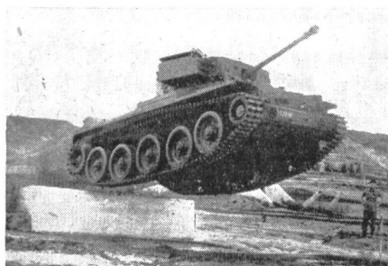
Demonstrationen britischer Panzerfahrzeuge in Bovington.

Temperament: Temperamentvoll, lebhaft, ausgelassen, ruhig, gesetzt,