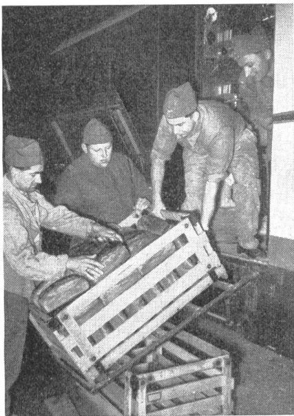
Von der Arbeit unserer Verpflegungsgruppen. In einer Feldbäckerei wird das ausgebackene Brot zur Verteilung vorbereitet.

Befehl: Gruppe Zürcher Richtung Häuser, im Sturm weiter vorrücken — marsch!