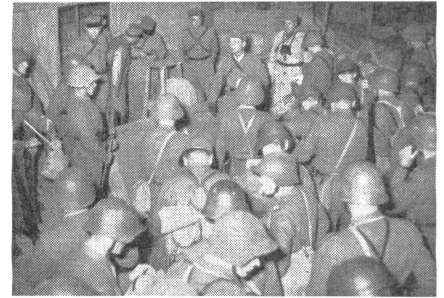
Felddienstübung des UOV der Stadt Bern Befehlsausgabe durch den Übungsleiter.