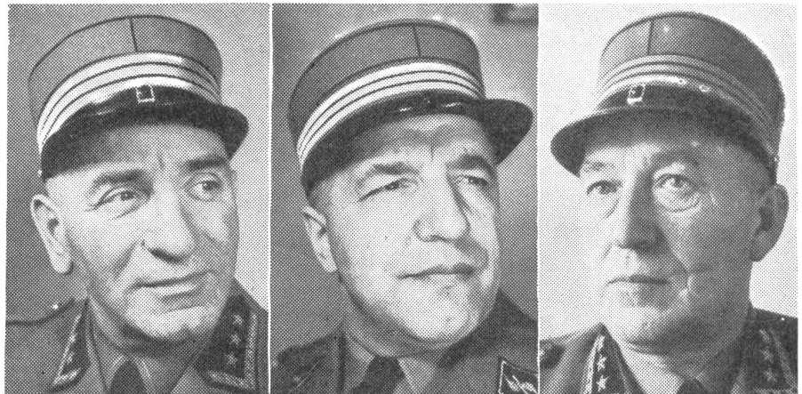
Der Bundesrat ernennt drei Oberstbrigadiers.

Die größte Gefahr ist im psychologischen Schrecken des Mannes zu sehen, der einem ihm völlig unbekanntem Geschehen machtlos gegenübersteht! (Fortsetzung folgt)