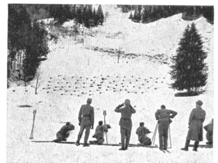
VIII. Militär-Skiwettkämpfe des SUOV am Schwarzsee. Nach 5,5 km wurde von den Patrouillen der Schießplatz erreicht. Die Organisation war reibungslos und im Allgemeinen wurde von den Unteroffizieren sehr gut geschossen.