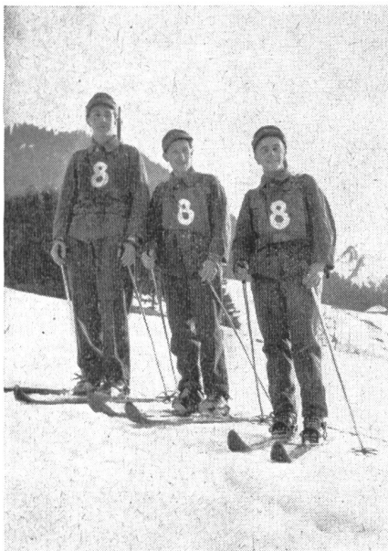
VIII. Militär-Skiwettkämpfe des SUOV am Schwarzsee. Die Mannschaft II des UOV Sensebezirk belegte in der Abfahrt mit 4 Stunden, 18 Minuten, 2 Sekunden den 3. Rang und wurde mit der Silbermedaille ausgezeichnet.