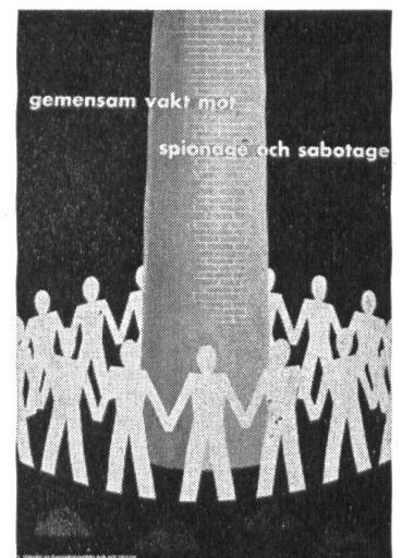
Gemeinsame Wacht gegen Spionage und Sabotage.