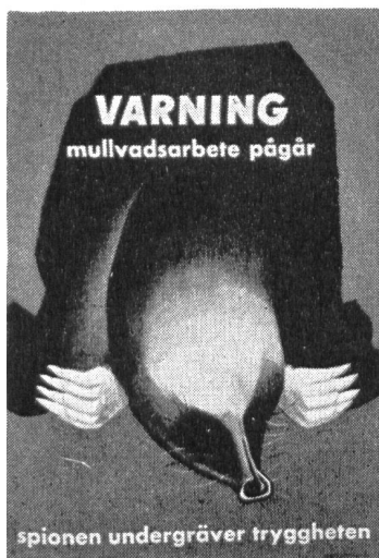
Achtung! Maulwurfsarbeiten im Gange. Demaskiere Spione und Saboteure! Spione untergraben die Sicherheit!

Die Vereinigung «Volk och Försvar» (Volk und Verteidigung), die, aus allen Schichten und Kreisen zusammengesetzt, sich in Schweden um die Aufklärung der Bevölkerung und die Unterstützung der Landesverteidigung verdient macht, hat eine Reihe eindringlicher Plakate drucken und verteilen lassen, die sich mit der Abwehr von Spionage und Sabotage befassen. Unser Bild zeigt eine Serie von vier Plakaten, die folgende Texte tragen: