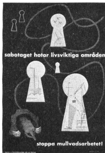
Die Sabotage bedroht lebenswichtige Gebiete, stopp der Maulwurfsarbeit!