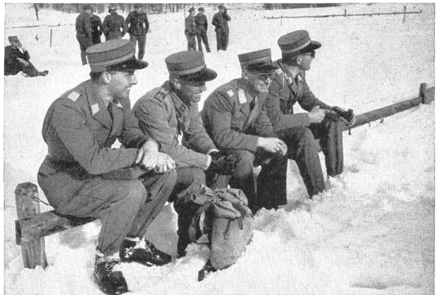
Bekannte Schweizer Vierkämpfer, die seit Jahren zu unseren aktivsten Wehrsportlern gehören. Von links nach rechts: Oblt.