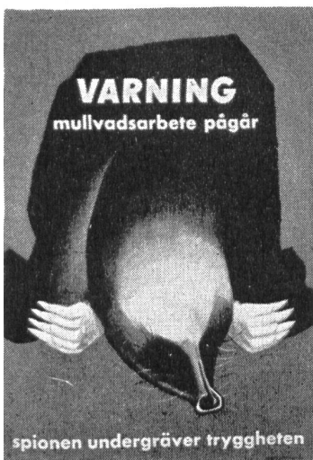
Achtung! Maulwurfsarbeiten im Gange. Demaskiere Spione und Saboteure! Spione untergraben die Sicherheit!

Die Vereinigung «Volk och Försvar» (Volk und Verteidigung), die, aus allen Schichten und Kreisen zusammengesetzt, sich in Schweden um die Aufklärung der Bevölkerung und die Unterstützung der Landesverteidigung verdient macht, hat eine Reihe eindringlicher Plakate drucken und verteilen lassen, die sich mit der Abwehr von Spionage und Sabotage befassen. Unser Bild zeigt eine Serie von vier Plakaten, die folgende Texte tragen: