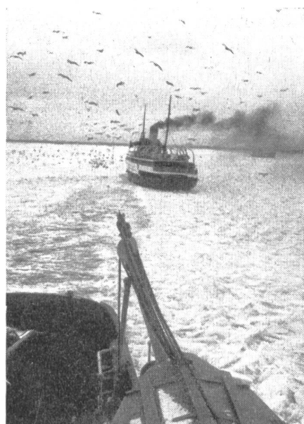
Militär-Ski-Weltmeisterschaften 1954. Das steckengebliebene Kursschiff im Öre-Sund.

Sollefteå liegt 1400 km nördlich von Malmö am Ängermanälven-Strom. Es ist eine kleine Stadt mit ca. 10 000 Einwohnern mit großem Einzugsgebiet und etwas Industrie. Wie in ganz Schweden fallen einem die riesigen Waldungen auf. Auf dem