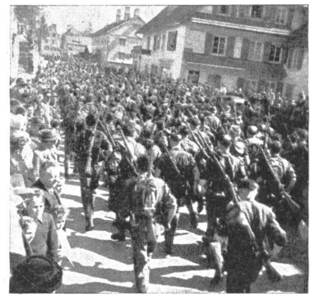
Gedenklauf Le Locle—Neuenburg. Nach dem Start der 400 Teilnehmer in Le Locle.

schieden, wo hinter einem hohen Maste mit einer großen Schweizerfahne über dem Mittelland das herrliche Panorama des hehren Alpenkranzes grüßte. An dieses Bild dachte auch Oberst Marti, Kommandant des Inf. Rgt. 8, als er am gemeinsamen Mittagessen