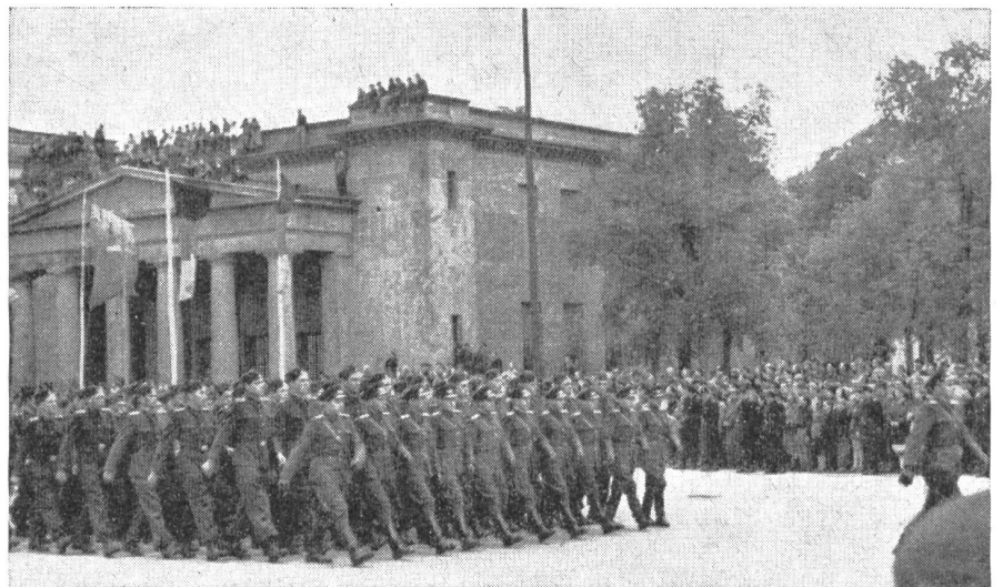
Parade der ostdeutschen Armee. Die Soldaten unterscheiden sich in Schritt und Farbe kaum mehr von den Angehörigen der russischen Besatzungstruppen.

Wm. H. F. in E. Leider muß ich darauf verzichten. Ihre Ausführungen entsprechen zum Teil nicht mehr den heutigen Gegebenheiten, und zum andern sind sie abwegig, weil die Voraussetzungen dafür fehlen. Es ist sicher richtig, daß unsere Spielleute als Hilfsanitäter ausgebildet werden. So gerne wir sie heute musizieren hören, so froh könnten wir allenfalls sein, wenn sie sich auch auf das Anlegen eines Verbandes verstehen.