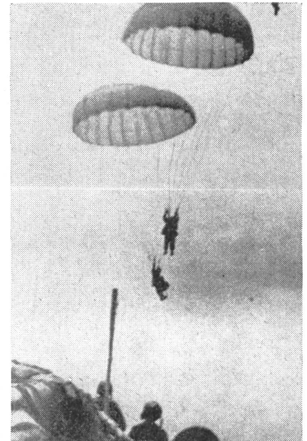
Die Verstärkung der eingeschlossenen Garnison von Dien Bien Phu ist nur auf dem Luftwege möglich. Hier gehen Fallschirmjäger über den Linien der Verteidiger nieder.