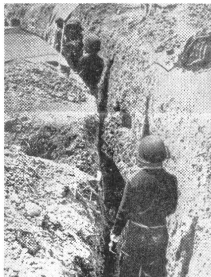
Mit aller Energie wurden die Verteidigungsstellungen ausgebaut, so daß nun eine Chance besteht, die Angriffe der vierfachen kommunistischen Uebermacht abwehren zu können.