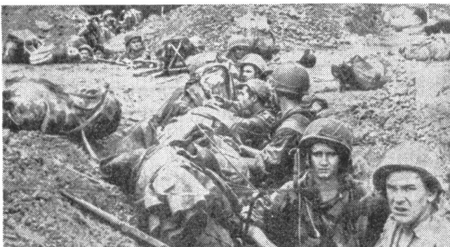
Blick in einen von der Fremdenlegion besetzten Schützengraben. Es sind Fallschirmjäger, die zur Verstärkung der Garnison über dem von den Kommunisten eingeschlossenen Stützpunkt absprangen.