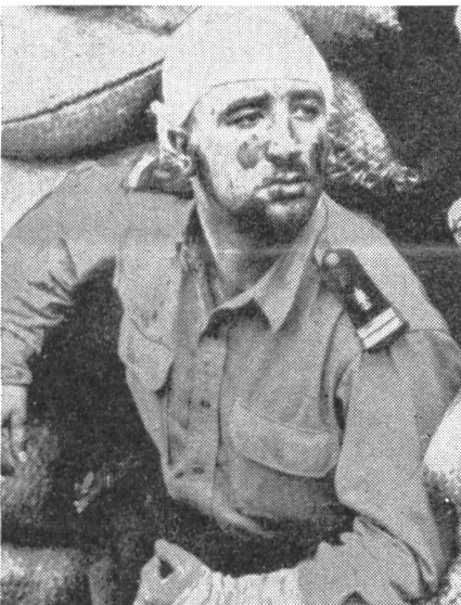
Dieser Leutnant der Fremdenlegion ist einer der unbekanntesten Kämpfer von Dien Bien Phu, die einen heroischen Kampf geliefert haben. An Kopf und Händen verletzt, verfolgt er die Kämpfe.