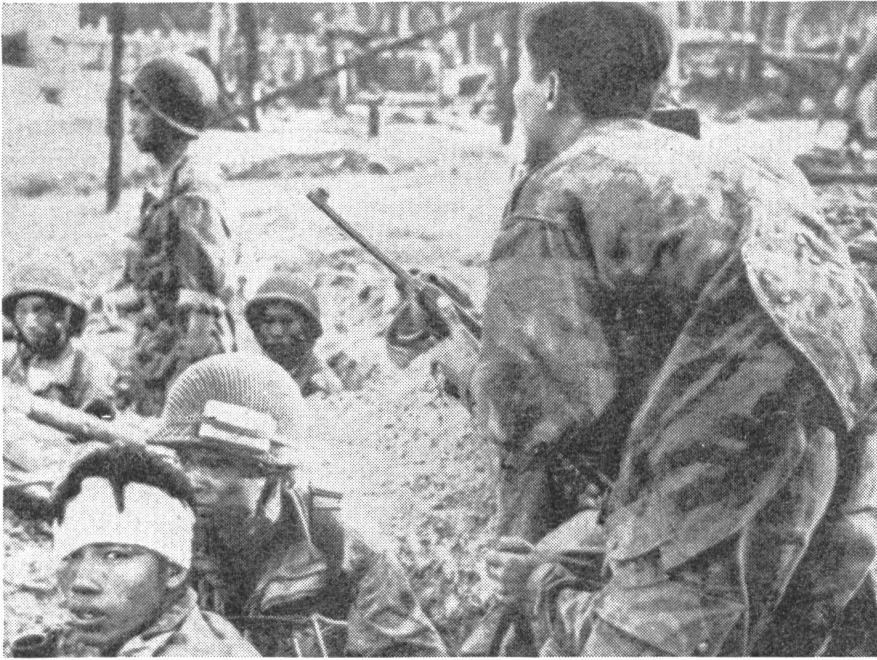
Eingeborene Verteidiger von Dien Bien Phu in Erwartung eines kommunistischen Angriffs. Die Verteidiger setzen sich in der Hauptsache aus Nordafrikanern, Fremdenlegionären und Vietnamesen zusammen.