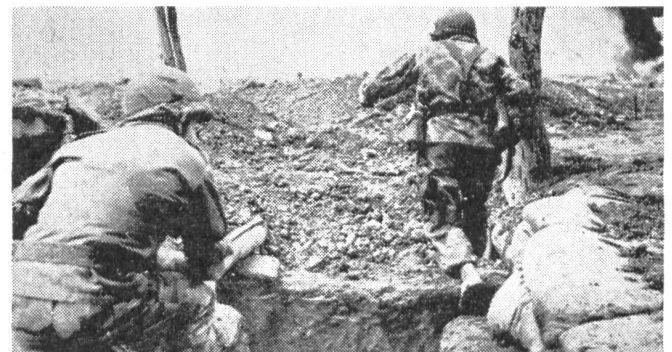
Höhepunkt der Kämpfe: Fremdenlegionäre in vorderster Front, die zum Gegenangriff übergehen.